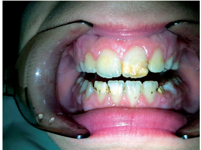
Mordida abierta y displasia de esmalte

La posición de descanso o reposo de la cabeza ejerce una influencia decisiva en el desarrollo de maloclusión (24, 27, 28). Los músculos posturales mandibulares son parte de la cadena muscular que nos permite permanecer de pie. Cuando se producen cambios posturales, las contracciones musculares a nivel del sistema estomatognático cambian la posición mandibular debido a que el maxilar inferior para funcionar mejor busca y adopta nuevas posiciones ante la necesidad. Por lo tanto, una actitud postural incorrecta es considerada factor etiológico de maloclusiones. Los pacientes con PC que presentan trastornos posturales tendrían más probabilidades de desarrollar trastornos morfológicos en el área facial, influyendo finalmente en el tercio facial inferior y favoreciendo el desarrollo de la maloclusión. Una posición de reposo hiperextendida de la cabeza puede contribuir al desarrollo de maloclusiones de clase II, aumento del resalte y mayor mordida abierta (25).