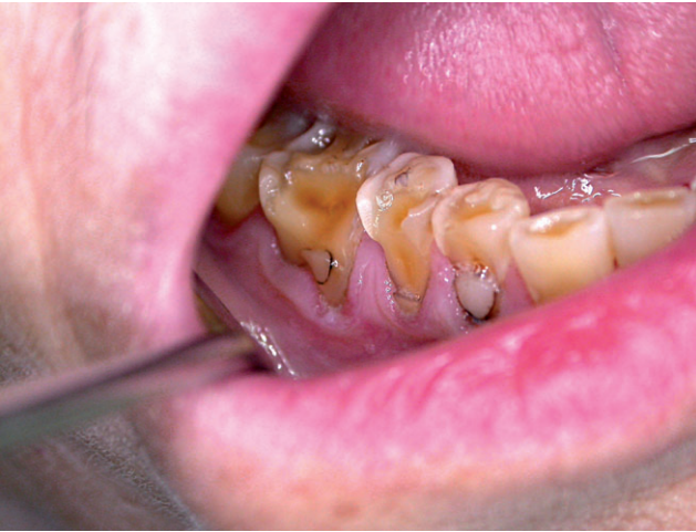
Erosión dental afectando preferentemente a los cuellos

Los pacientes con PC a menudo padecen reflujo gastroesofágico que puede producir problemas de aspiración y erosiones dentarias (37). Se debe evitar la ingesta de alimentos y bebidas de carácter ácido y de bebidas carbonatadas que favorecen la reducción del pH bucal por debajo de 5,5. Se recomienda la aplicación de flúor tópico sobre los dientes para favorecer la remineralización del esmalte.