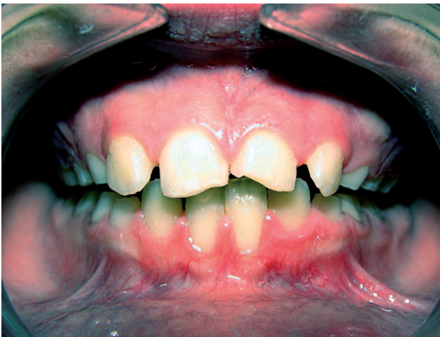
Traumatismos dentales en incisivos superiores

En estos pacientes existe una variada serie de factores que predisponen a los traumatismos dentales, tales como la alta prevalencia de maloclusión clase II con incisivos superiores protruidos e incompetencia de los labios (hipotonía labial) junto con las caídas que sufren por dificultad para la deambulación y por la coexistencia en ocasiones de convulsiones (23).